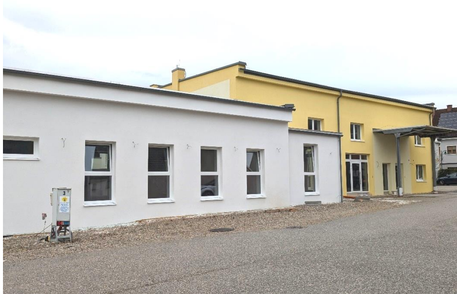
Die Außenfassadengestaltung ist bereits fertig. Davor kommen nun noch eine überdachte Eingangsrampe sowie die Grün- und Pflastergestaltung. Derzeit wird der Umbau im Innenbereich weiter vorangetrieben

Die Umbauarbeiten für unseren zusätzlichen zweiten Kindergarten im ehemaligen Postverteilerzentrum gehen nun in eine weitere Bauphase. Zuletzt wurden die Wände verputzt und ein Styroporbeton für den Fußbodenaufbau eingebracht. Als nächstes folgen die Montage der Fußbodenheizung und der Estrich. Besonders freuen wir uns auch auf die Außengestaltung. Hier soll der Platz vor dem Kindergarten grüner werden und im vorderen Bereich optisch an den Hauptplatz angeglichen werden. Wir hoffen, Ihnen mit der Dezember-Ausgabe unseres Gemeindeblatts die Einladung zur Eröffnung und Besichtigung überreichen zu dürfen.