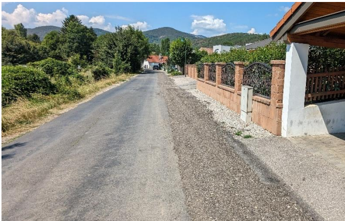
Bilder oben und unten: vor der Sanierung der Asphaltdecke....

Wir haben eine Geschwindigkeitsanzeige installiert, um den dortigen Verkehrsteilnehmern ein Gefühl für das gefahrene Tempo zu geben und auch damit wir als Gemeinde ein Bild von den nun auf dem neuen Asphalt gefahrenen Geschwindigkeiten bekommen. Eine mehrwöchige Baustelle vor der Haustüre ist immer auch eine kleine Belastung und so danken wir allen Anrainern für Ihre Geduld und hoffen, dass sie viel Freude mit der erneuerten Infrastruktur haben.