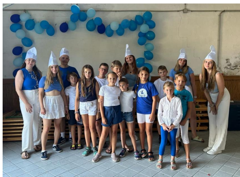
„Schlumpfhäuser“ im Pfarrzentrum Rothengrub. Die BetreuerInnen gaben sich viel Mühe, um den Kindern schöne Tage zu bereiten