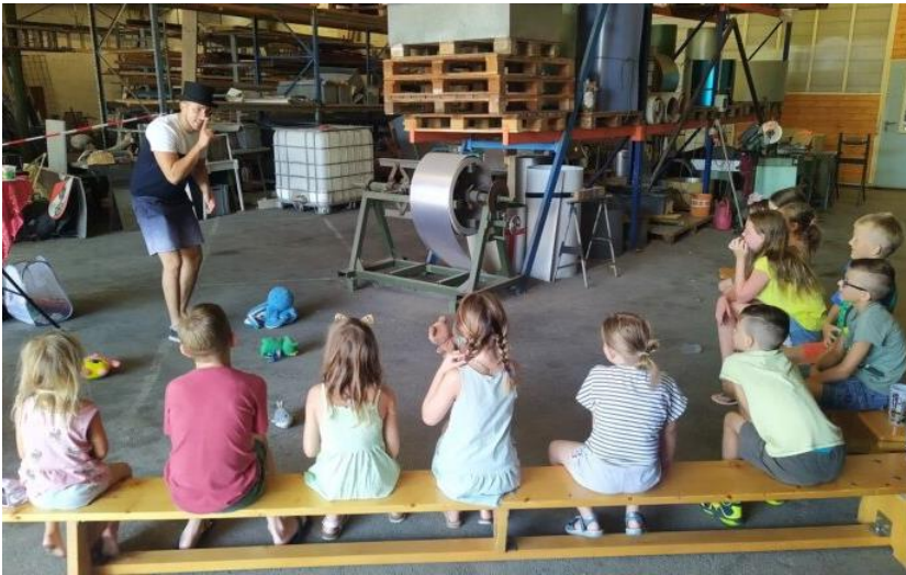
Der Zauberkurs mit Magier „Ilusian“ kam bei den Kindern richtig gut an. Bild unten: Am Bio-Bauernhof der Familie Haselbacher gab es richtig viel zu entdecken und die Kinder hatten großen Spaß.