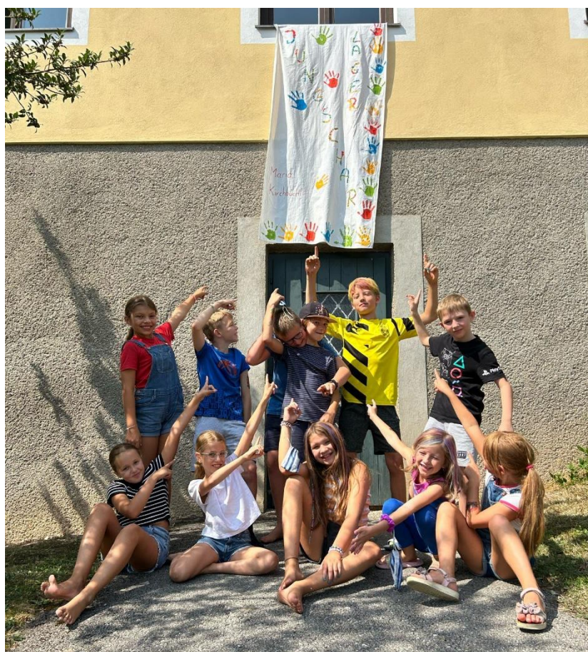
Die Kinder hatten beim Jungscharlager viel Spaß und die Aktivitäten förderten den Zusammenhalt enorm

Das Jungscharlager war erneut ein voller Erfolg und bescherte allen ein unvergessliches Wochenende voller Freude, Kreativität und Gemeinschaft. Wir freuen uns schon jetzt auf das nächste Jahr, wenn es wieder heißt: Auf ins Jungscharlager!