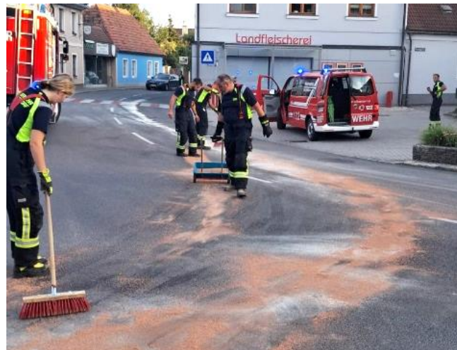
In den letzten Wochen kam es vermehrt zu Ölspuren, die von der Feuerwehr gebunden werden mussten

Wir bedanken uns auch bei allen, die uns während des Einsatzes mit Verpflegung versorgt haben sowie für die erhaltenen Spenden!