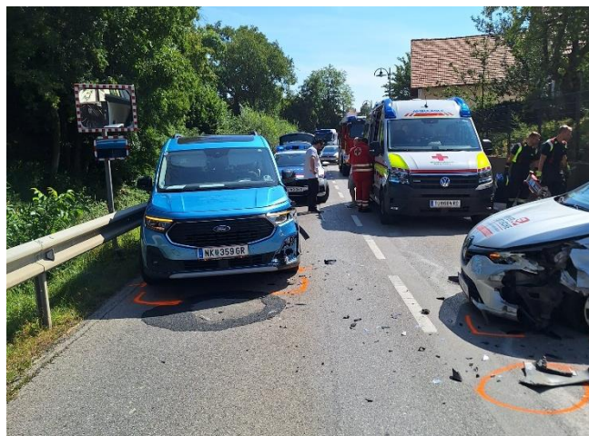
Am 12.8.2024 stießen zwei PKW aus ungeklärter Ursache auf der Puchberger Straße zusammen. Die Feuerwehr führte die Fahrzeugbergung durch und reinigte die Fahrbahn