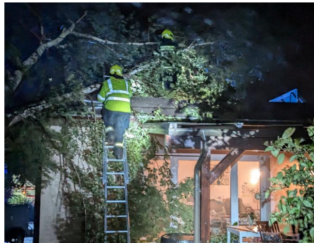
Der Unwettereinsatz verlangte der Mannschaft vieles ab. Zahlreiche umgestürzte Bäume mussten beseitigt werden.

Wir gratulieren unserer Feuerwehrjugend, welche beim Feuerwehrjugendleistungsabzeichen und dem Leistungsbewerb in Bronze angetreten sind und hervorragende Leistungen erbracht haben. Wir sind stolz auf euch!