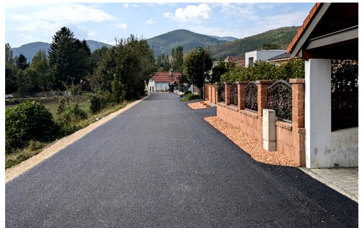
...und nach Fertigstellung der Neuasphaltierung