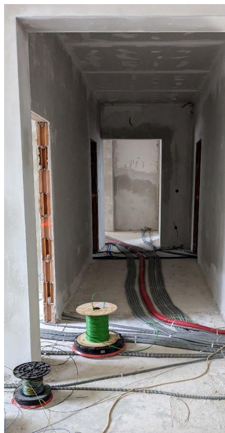
Die Elektro- und Wasserinstallationsarbeiten sind ebenfalls bereits abgeschlossen