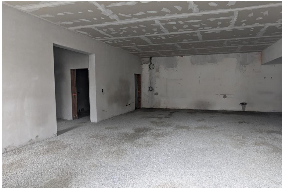
Mittlerweile ist der Styroporbeton eingebracht und es wurde begonnen die Fußbodenheizung zu verlegen. Nach der Austrocknungszeit des Estrichs wird dann bereits mit der finalen Phase begonnen. Damit ist Bodenverlegung, Ausmalen und die Errichtung der Akustikdecke gemeint. (Foto: Blick in den zukünftigen Bewegungsraum)

Wir gehen von geschätzten Baukosten in Höhe von rund € 750.000,- aus. Davon werden € 155.000,- direkt gefördert. Weiters bekommen wir von den „anerkannten Baukosten“ in