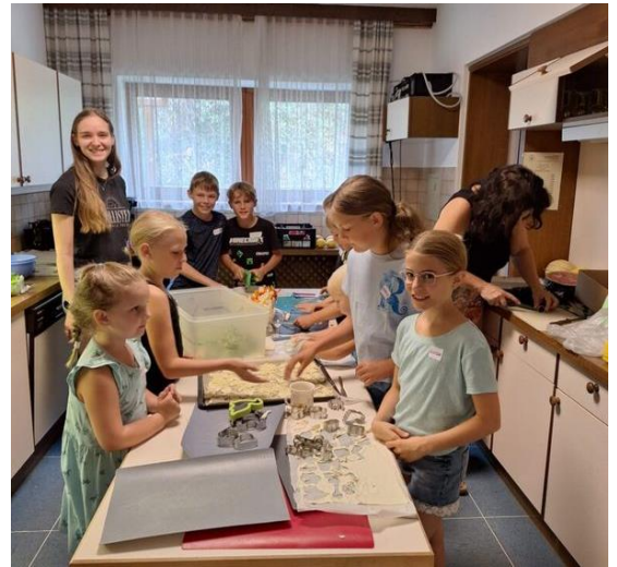
Beim Kochen im Pfarrheim lernten die Kinder spielerisch den Umgang mit Lebensmitteln und deren Verarbeitung.